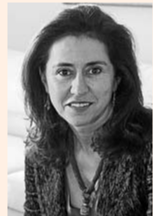
Ángeles Alarcó, presidenta de Paradores.